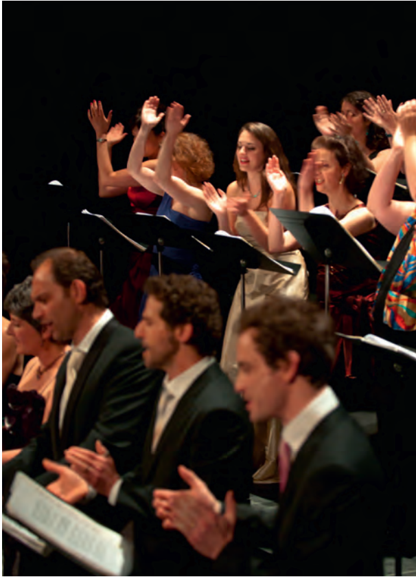
Le Chœur de l'Opéra de Lille