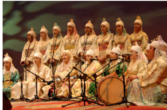
Ensemble Rhoum El Bakkali