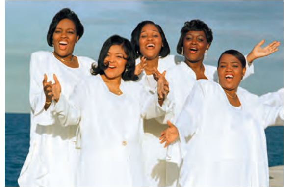
The Brown Sisters