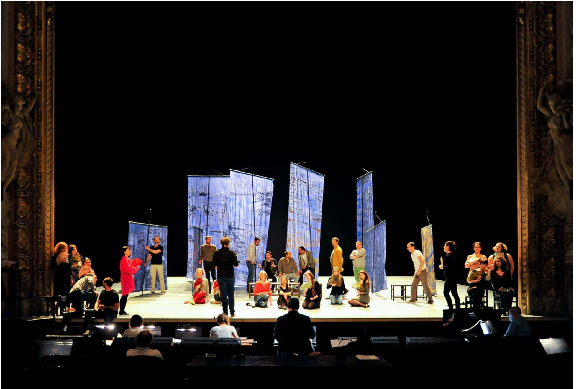
Séance de répétition de Madama Butterfly le 28 avril 2015 à l'Opéra de Lille