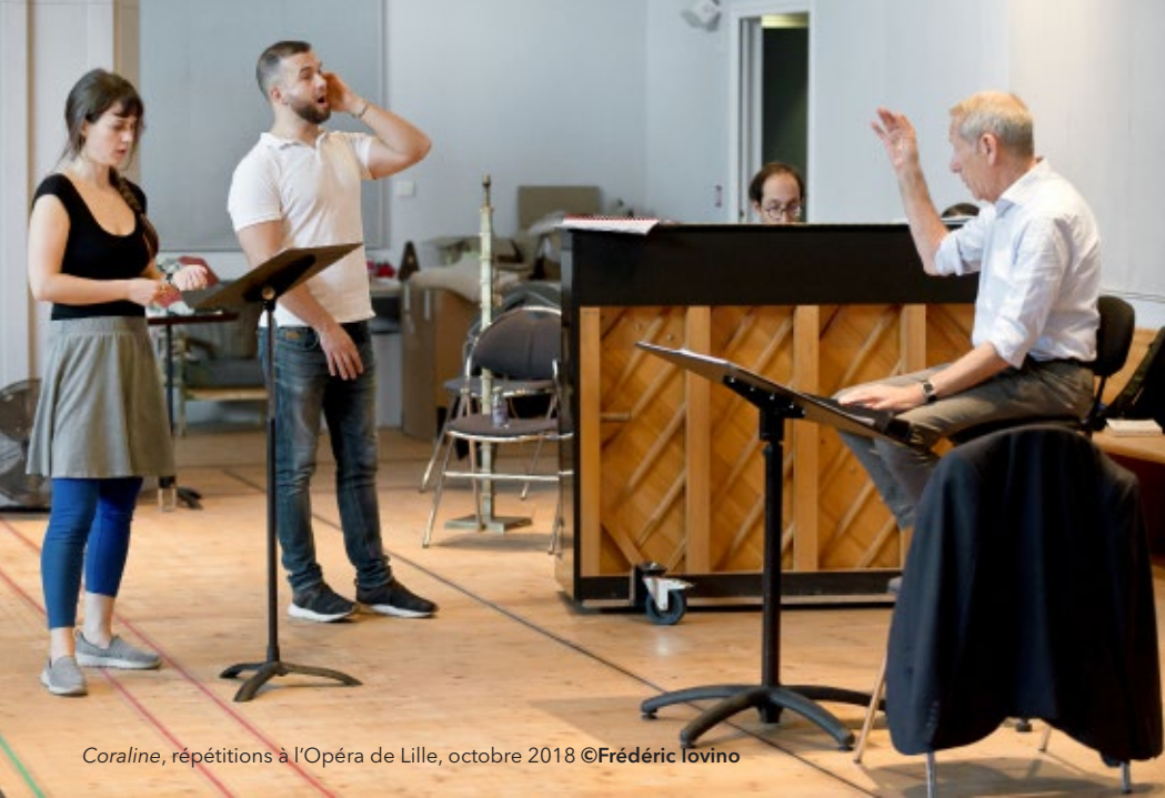
Coraline, répétitions à l'Opéra de Lille, octobre 2018