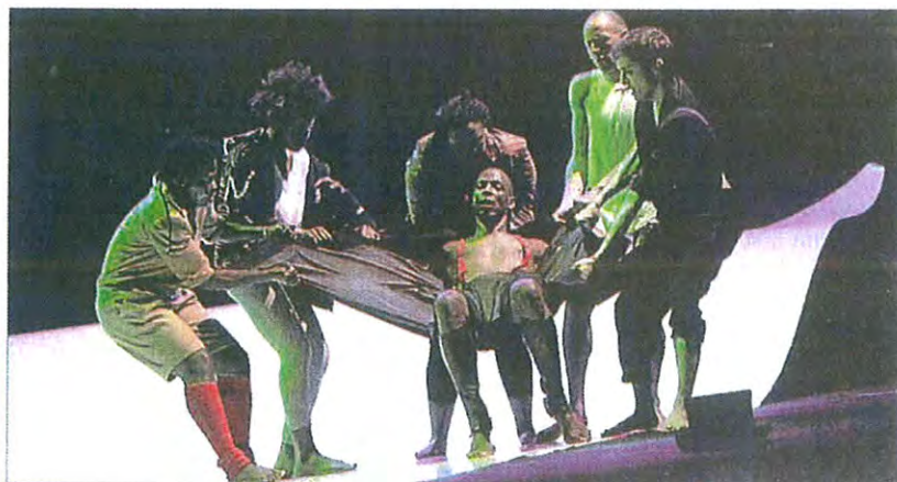
■ Un “Baron Samedi” qui parle de vécus et d’univers inquiétant.

Sur le plateau, le récit de plusieurs vécus qui parlent tous d'histoires de drames, d'esclavage, de soumission, de gé-