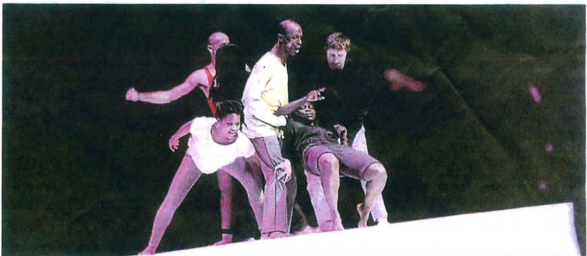
■ Une pièce chorégraphique où les métissages abondent grâce notamment à des danseurs d'origines les plus diverses.

Danse | Mardi au théâtre, le chorégraphe, en résidence à Nîmes, propose sa nouvelle création où il se confronte à la culture vaudou.